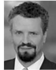
Gernot Erler, MdB