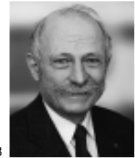
Rudolf Bindig, MdB